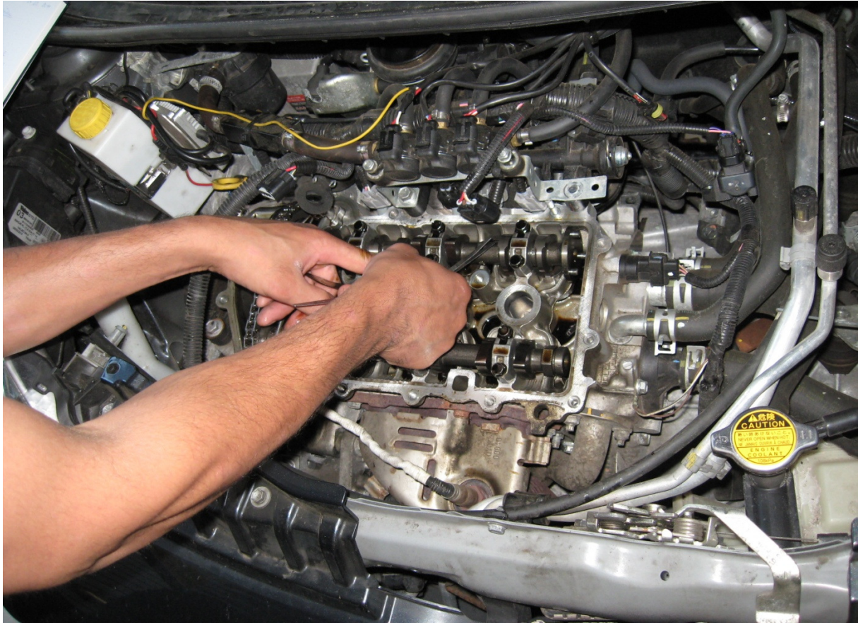
Abbildung / Picture 1: Ventilspielmessung / Measurement of valve clearance